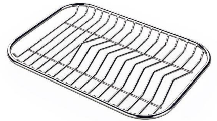
Tellerständer aus Edelstahl 8100 154