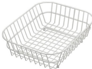
Weißer Korb 8612 100